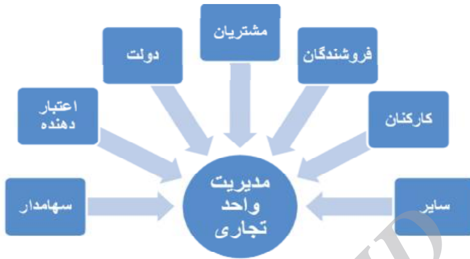
نگاره 1. واحد تجاری به‌عنوان مجموعه‌ای از قراردادها